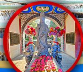
เจ้าแม่กวนอิมต้าลี่