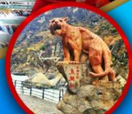
ช่องเขาเสือกระโจน