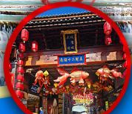
เมืองโบราณต้าลี่