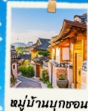
หมู่บ้านนุกซอน