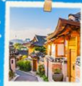
หมู่บ้านนูกซอน