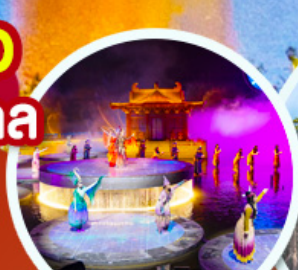
ชมโชว์อุทนีโจว