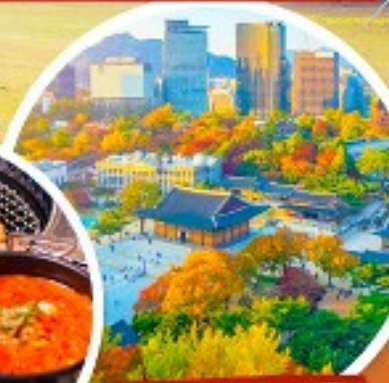
พระราชวังเคียงอกซุกง