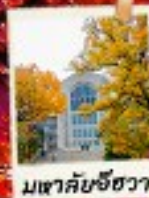
มเขาคัยชีฮวา