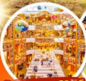
ห้องสมุดสตาร์ฟิชต์