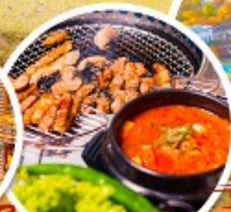
ตัวอย่างเกาหลี