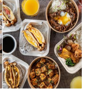
Hotel Flexstay Hakodate Ekimae