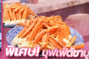
พิเศษ! บุฟเฟ่ต์ซาซิมิ

กำหนดเดินทางเดือน เมษายน - มิถุนายน 2567