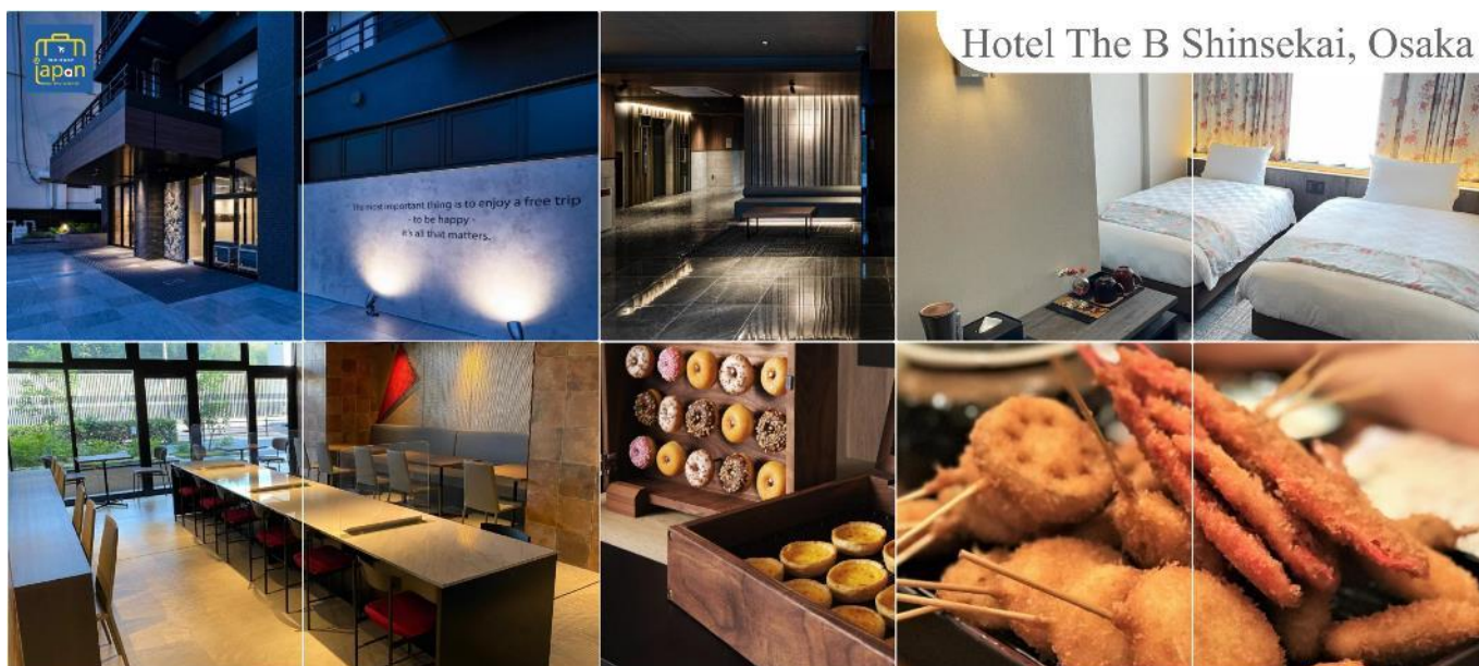
Hotel The B Shinsekai, Osaka

พักที่ HOTEL THE B SHINSEKAI, OSAKA หรือเทียบเท่าระดับเดียวกัน