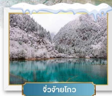
จิวจ้ายโกว