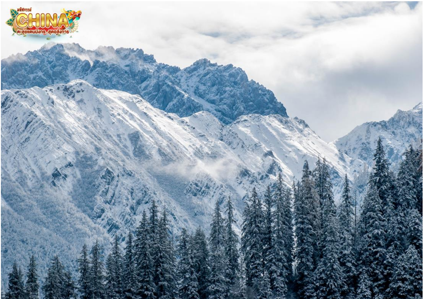
สถานที่ท่องเที่ยวที่ภายในอุทยานแห่งชาติจิวจ้ายโกว

นำท่านเดินทางสู่ อุทยานแห่งชาติจิวจ้ายโกว (โดยรถของอุทยาน) เพื่อชมมรดกโลกอุทยานแห่งชาติธารสวรรค์ “จิวจ้ายโกว” หนึ่งในมรดกโลกทางธรรมชาติของประเทศจีนที่ขึ้นชื่อเรื่องความสวยงามของภูเขา ลำธาร น้ำตก และทะเลสาบ ตั้งอยู่สูงกว่าระดับน้ำทะเลถึง 2,500 เมตร ภายในอาณาบริเวณอุทยานจิวจ้ายโกวประกอบด้วยภูเขาและหุบเขาอันสลับซับซ้อน เนื่องจากพื้นที่ส่วนใหญ่มีระดับพื้นดินที่ลดหลั่นจึงทำให้เกิดแอ่งน้ำน้อยใหญ่มากมาย ทั้งกลุ่มน้ำตกใหญ่น้อยและแม่น้ำ ซึ่งไหลมาจากหุบเขารวม 5 สาย ในยามฤดูใบไม้เปลี่ยนสีนั้น สีสนของทะเลสาบแห่งนี้จะเต็มไปด้วย สีแดง สีส้ม สีเหลือง ของใบไม้ที่ปลิดปลิวร่วงหล่นลงไปทะเลสาบ หากเป็นช่วงฤดูหนาวก็จะถูกปกคลุมไปด้วยหิมะให้บรรยากาศที่สวยงามไปในอีกรูปแบบหนึ่ง จนได้รับฉายาว่า “ดินแดนแห่งเทพนิยาย” (หมายเหตุ: ราคาชมมรดกอุทยานแล้ว (รถเวียน) หากต้องการเหมารถแบบส่วนตัวทั้งกรุ๊ป ต้องชำระเพิ่มกับทางไกด์ท้องถิ่นหรือหัวหน้าทัวร์)