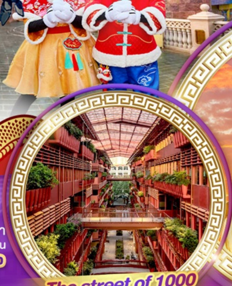
The street of 1000 red jars

สักการะพระใหญ่หลิงซานต้าฟอ ถ่ายรูปคู่กันดื่มยักษ์ ชมสุดยอดพุทธศิลป์ร่วมสมัยของจีน "ศาลาฟานกง"