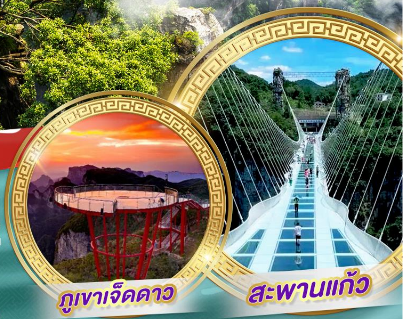
ภูเขาจี้ดดาว