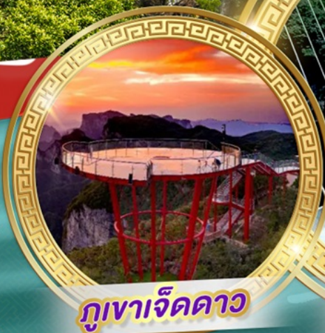
กูเงาเจ็ดดาว