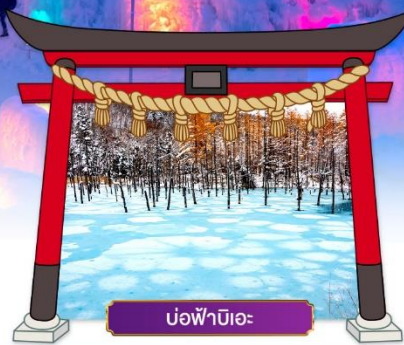
บ่อฟ้าบิเอะ