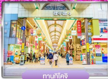
ทานุกิโคจิ