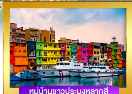
หมู่บ้านชาวประมงหลากสี