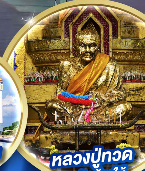
หลวงพ่อทวด ณ วัดช้างให้