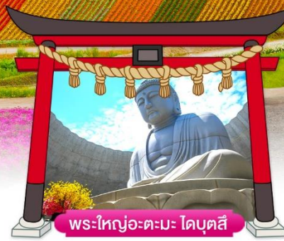
พระใหญ่อะตะมะ โดบุตสึ