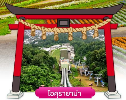
โอคุรายาม่า