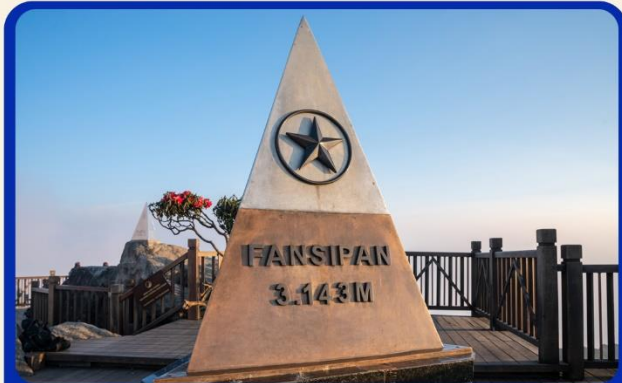
น้ิงกระเช้าสู่ยอดเขาฟานซิปัน