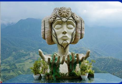
เชคอิน โมอาน่า (Moana Sapa Cafe)