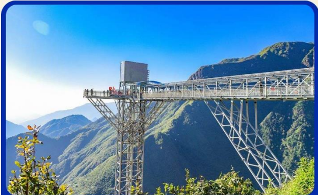
สะพานแก้วมังกรเมฆ (Rong May Glass Bridge)