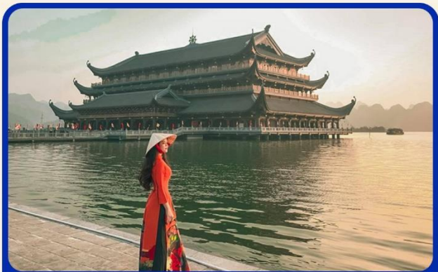
จุดเชคอินแห่งใหม่ "วัดตามจุ๊ก"