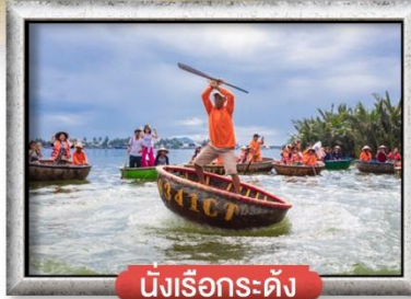
นั่งเรือกระดิง