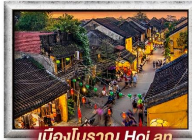
เมืองโบราณ Hoi an