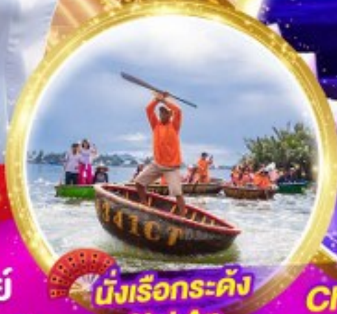
นั่งเรือกระด้ง Hoi An