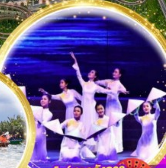
โชว์สุดอลังการ Charming at danang