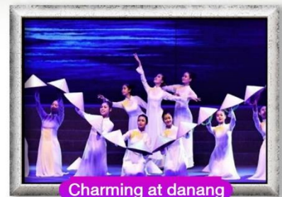
Charming at danang