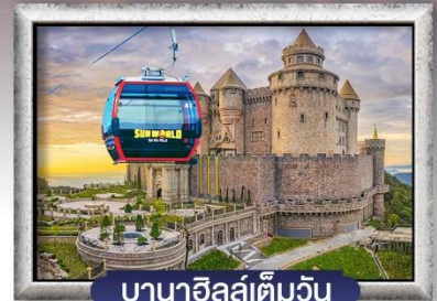
บาน่าฮิลล์เต็มวัน