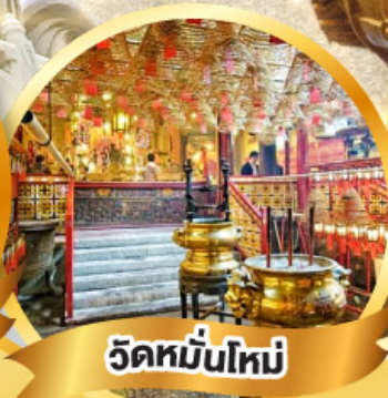
วัดหมื่นใหม่