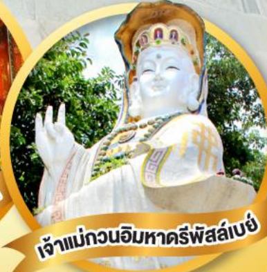
เจ้าแม่กวนอิมหาครีพิสล่าเบย์