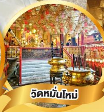
วัดมื่นใหม่