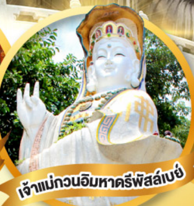
เจ้าแม่กวนอิมหาครีพิศลเบย์