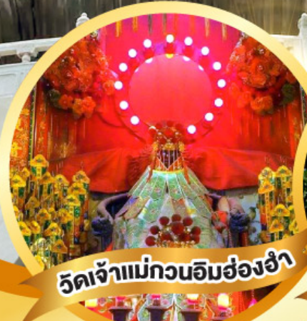
วัดเจ้าแม่กวนอิมฮ่องฮำ