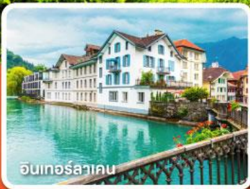
อินเทอร์ลาคอน