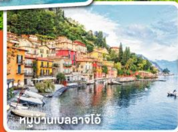
หมู่บ้านเบลลาจีโอ