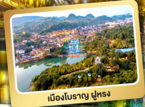
เมืองโบราณ ฟูหลง