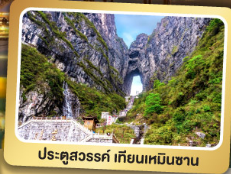
ประตูสวรรค์ เทียนเหมินซาน