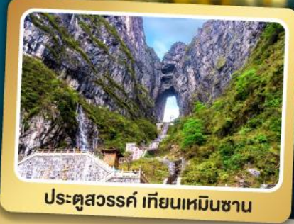
ประตูสวรรค์ เทียนเหมินซาน