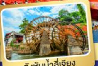
กังหันน้ำลี่เจียง