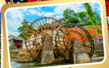
กังหันน้ำลี่เจียง