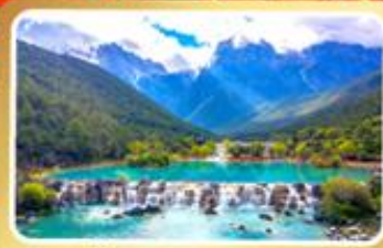
หุบเขาน้ำเงินทะเลสาบโป๋สุยเหอ