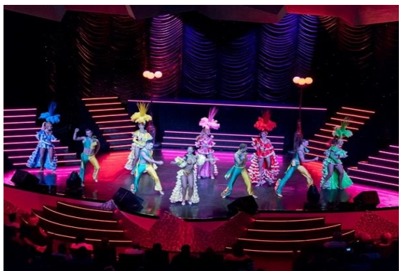
QQCRTKO-MS016 TOKYO-JEJU-KAGOSHIMA 6D5N (CRUISE ONLY) MSC BELLISSIMA