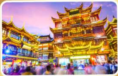
ตลาดร้อยปีเจิ้งหวงเมี่ยว