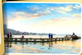
ทะเลสาบซีหู