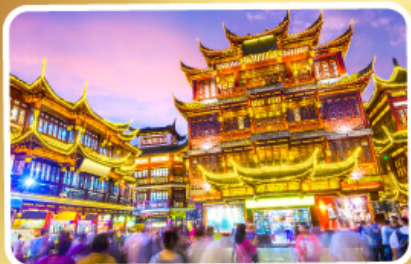
ตลาดร้อยปีเจิ้งหวงเมี่ยว