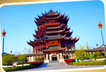
วัดฉงหยวน