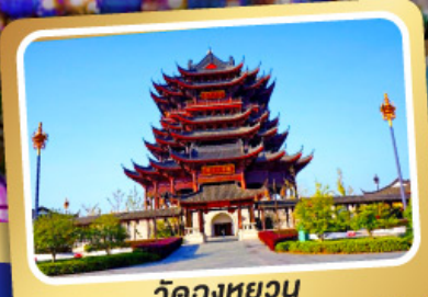
วัดวงหยวน