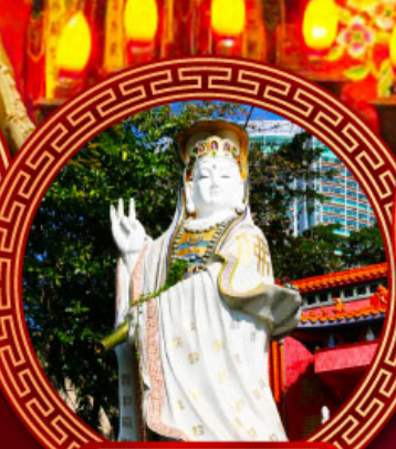
เจ้าแม่กวนอิม รีพัลส์เบย์