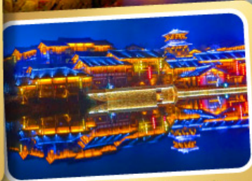
Oriental Salt Lake City