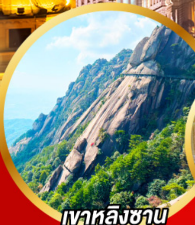
เวาหลิงซาน