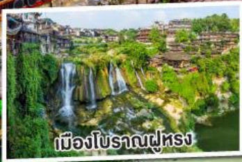
เมืองโบราณฟูหรง