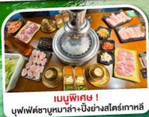
เมนูพิเศษ! บุฟเฟ่ต์ชาบูหม่าล่า+บิงย่างสไตล์เกาหลี