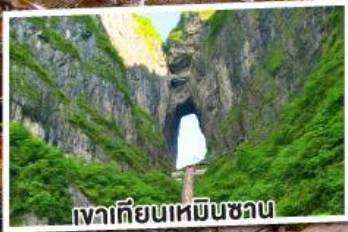
เงาเทียนเหมินชวน