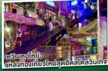
ช้อปปิ้งไฮโซ ที่แหล่งท่องเที่ยวใหม่สุดฮิตสไตล์ลันเตง