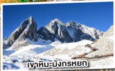
เขาสหิมะมังกรหยก