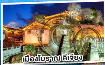
เมืองโบราณ ลี่เจียง