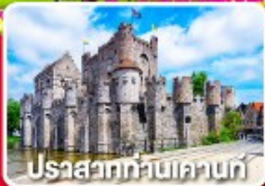
ปราสาทท่านแคนท์