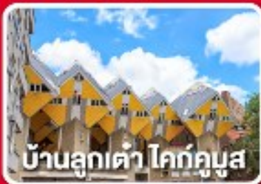
บ้านลูกเต่า โคกคูซ