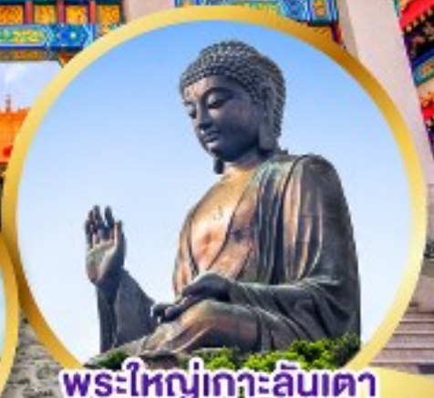
พระใหญ่เกาะลันเตา