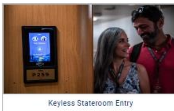
Keyless Stateroom Entry