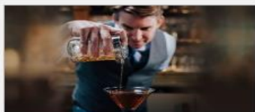
Good Spirits At Sea