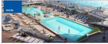
Pools (Retreat, Wakeview, Top Deck)