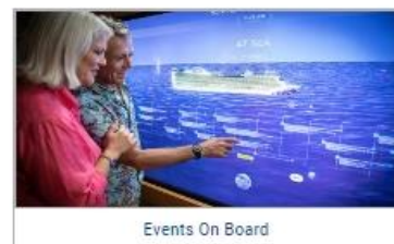
Events On Board