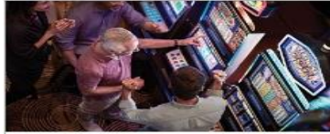
Vegas Style Casino