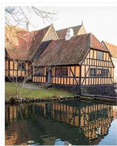
Aarhus , Norway