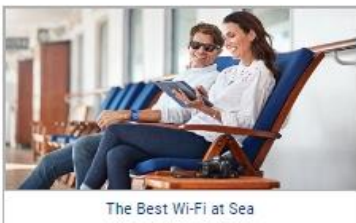
The Best Wi-Fi at Sea