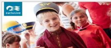
Discovery at SEA Programs