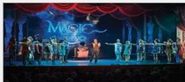
Original Musical Productions