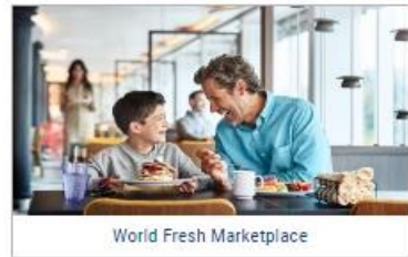
World Fresh Marketplace