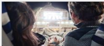
Movies Under the Stars®

On every Princess ship, you'll find so many ways to play, day or night. Explore The Shops of Princess, celebrate cultures at our Festivals of the World or learn a new talent – our onboard activities will keep you engaged every moment of your cruise vacation. 1