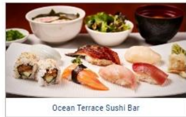
Ocean Terrace Sushi Bar