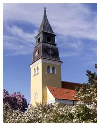
Skagen , Denmark