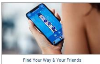
Find Your Way & Your Friends