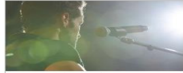
Vista Show Lounge