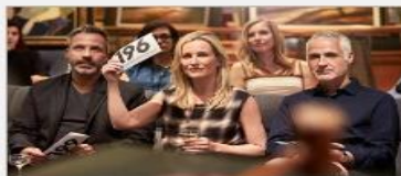
Art Gallery & Auctions