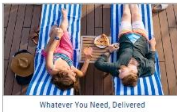
Whatever You Need, Delivered