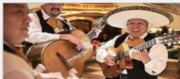
Music & Dancing