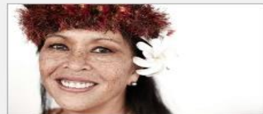
Festivals of the World