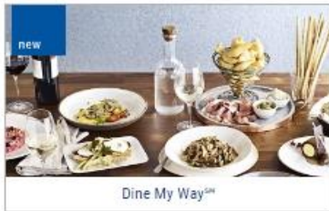
Dine My Way™

Indulge your appetite whenever you wish on board Princess®. Every hour, our chefs are busy baking, grilling and sautéing great-tasting fare from scratch. Princess offers unparalleled inclusive dining options throughout the ship with a wide range of culinary delights to suit any palate, from endless buffet choice to gourmet pizza, frosty treats, decadent desserts and much more.!