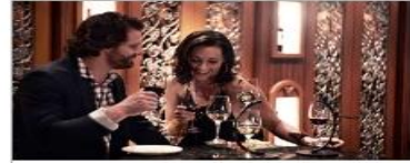
Vines Wine Bar