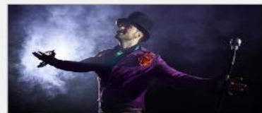
Featured Guest Entertainers