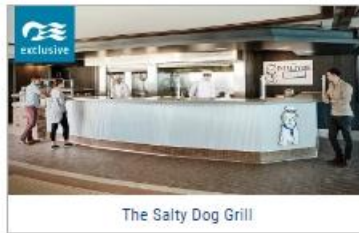
The Salty Dog Grill