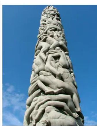
Oslo , Norway