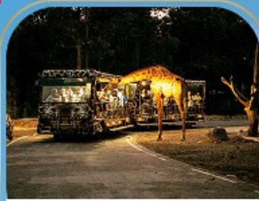
เชียงใหม่ไนท์ซาฟารี