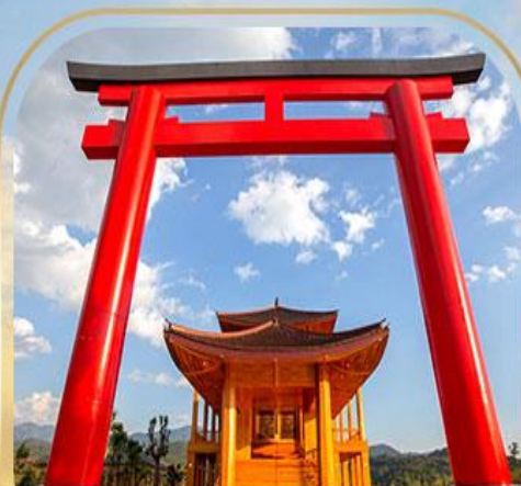
ฮิโนกิแลนด์