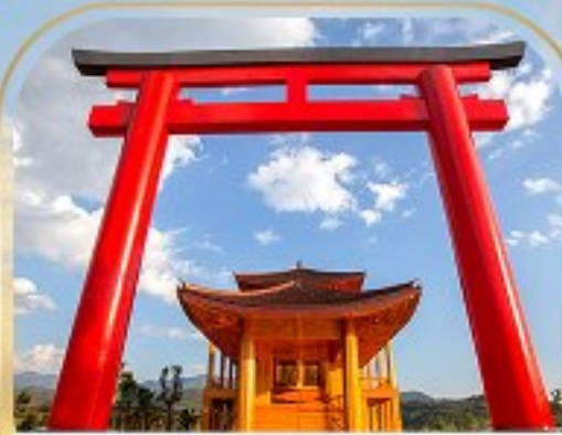
ฮิโนกิแลนด์