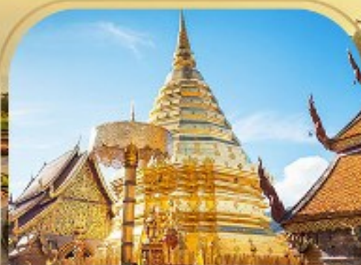
พระธาตุดอยสุเทพราชวรวิหาร