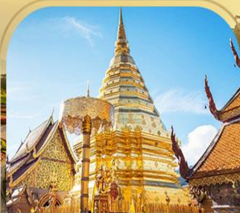
พระธาตุดอยสุเทพราชวรวิหาร