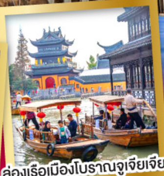
ล่องเรือเมืองโบราณจูเจียเจียว