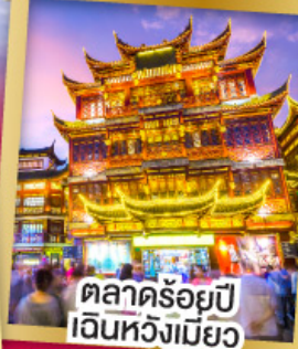
ตลาดร้อยปี เงินหวังเมี่ยว