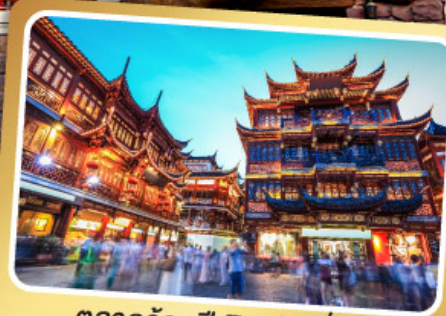
ตลาดร้อยปีเฉิงหวังเหมียว