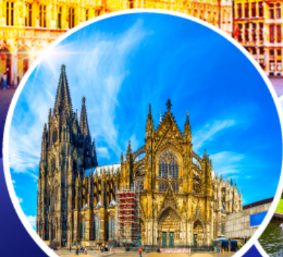
มหาวิหารแห่งโคโลญ หมู่บ้านก็ธูร์น