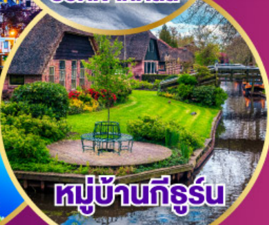
หมู่บ้านที่รูร์น