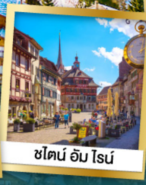
ชิลอน อัม โรน