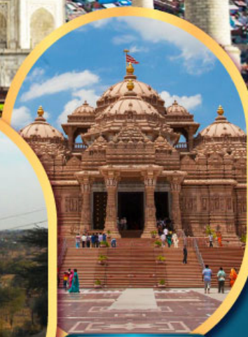
วิหารอักซาร์ดัม