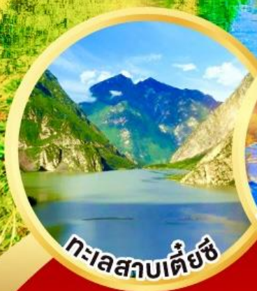
ทะเลสาบเต๋ยซี