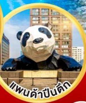
แพนด้าป็นตึก