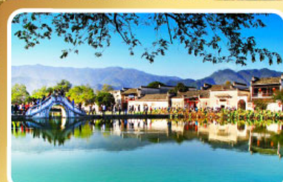
หมู่บ้านผดงโลก หงซุน