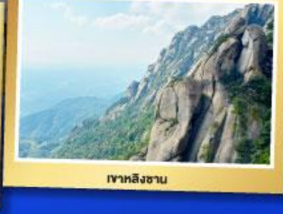
เขาหลงซาน