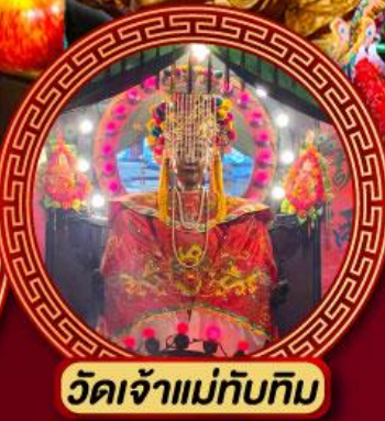
วัดเจ้าแม่ทับทิม