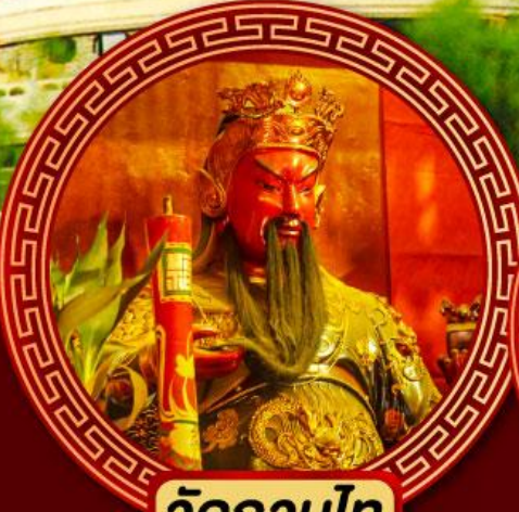
วัดกวนไท