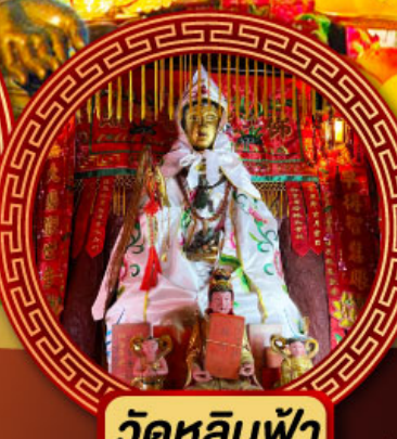
วัดหลินฟ้า