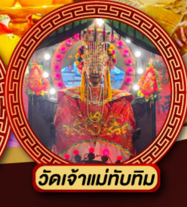
วัดเจ้าแม่ทับทิม