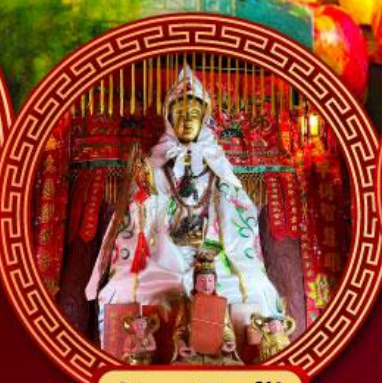
วัดหลินฟ้า