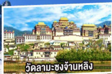
วัดลามะซงจ้านหลี่