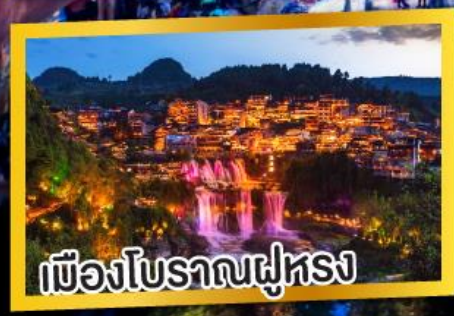
เมืองโบราณฟูหรง