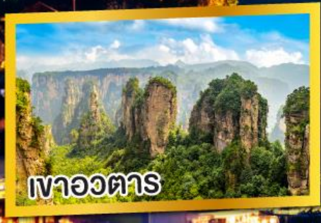
เขาวงตาร