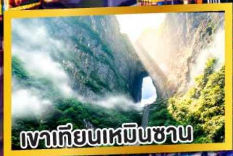
เขากีเยนเหมินชาน