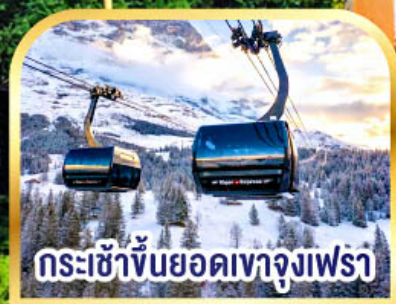
กระเช้าขึ้นยอดเขาจุงเฟรา