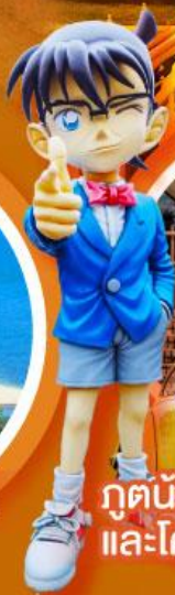
กูดน้อย คิตาโร่ และโคนัน