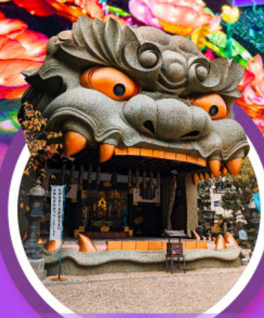
ศาลเจ้านิมบะ ยาชากะ