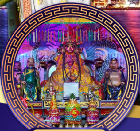
ศาลเจ้าหังเจีย