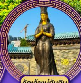
วัดเจ้าแม่กิมทิม